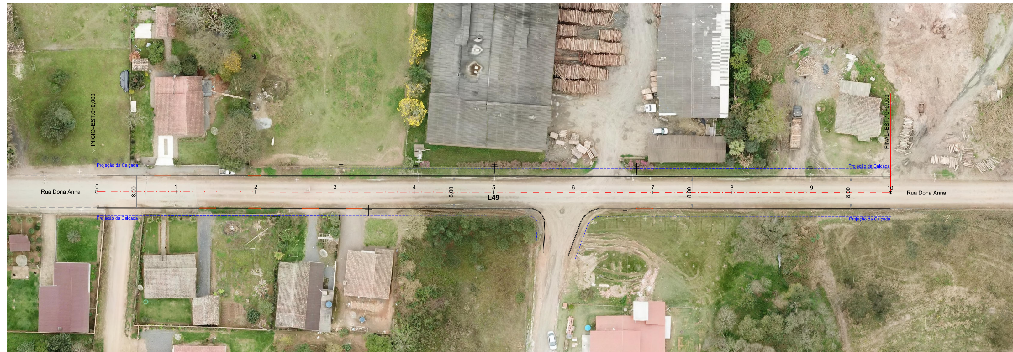
Planta Baixa Est: 0 + 0,00 à 10 + 0,00 Esc: 1/500